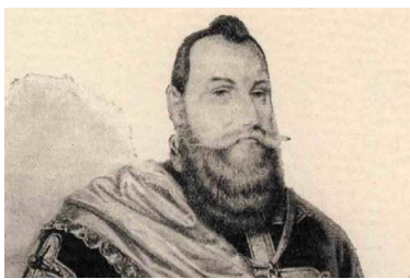
Ő Wesselényi Ferenc