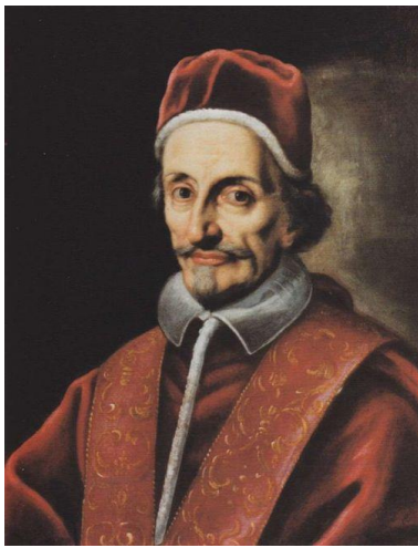
Ő XI. Ince pápa