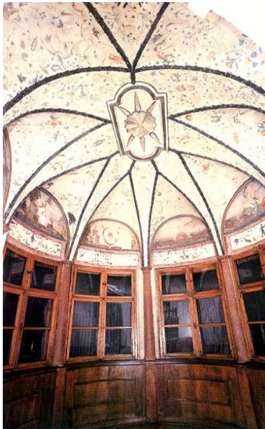
Erről a teremből lenne szó – Sárospatak, a mennyezetén a rózsák

Egy híres latin kifejezés: „sub rosa” azt jelenti magyarul: a rózsá alatt, amit úgy kell értelmezni, hogy titokban. Ennek az a magyarázata, hogy a sárospataki várban, annak a teremnek a tetejét, amiben összegyűltek Wesselényiék, a mennyezetét rózsák díszítik. Itt tanácskoztak titokban, azaz a rózsák alatt, tehát latinul: sub rosa)