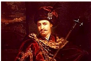
Ő Thököly Imre